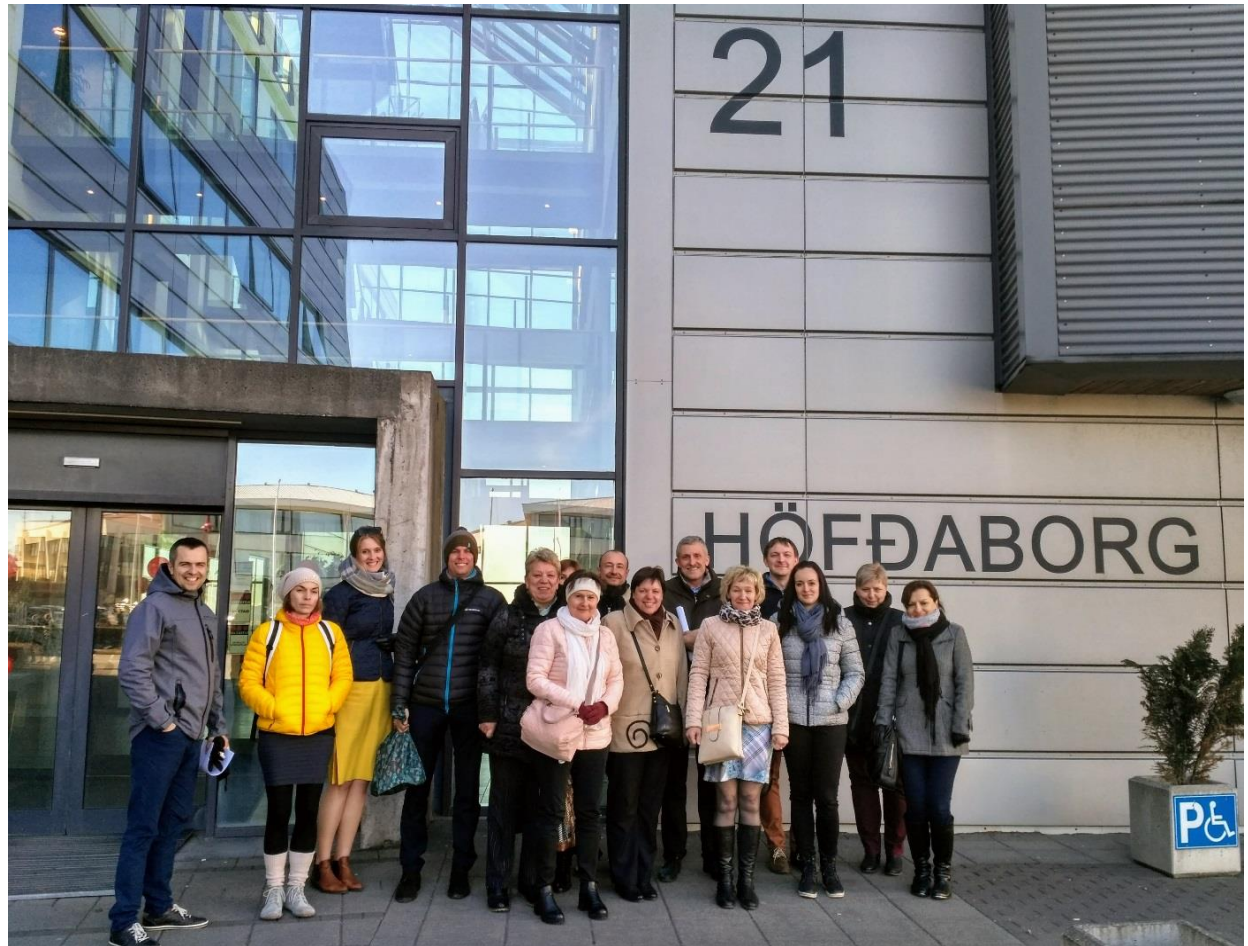
Foto: Společná fotografie před islandskou Vládní agenturou pro ochranu dětí, Zlínský kraj