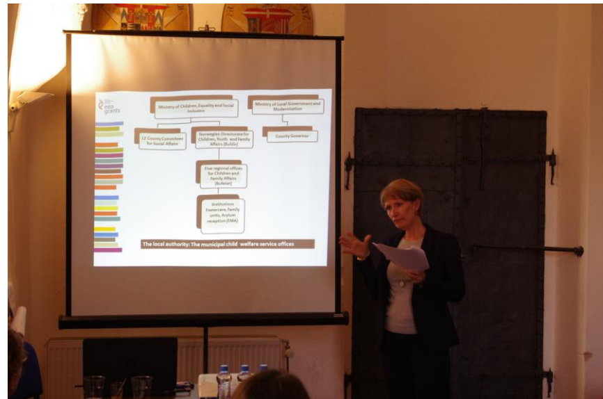
Foto: Zleva prezentace Bufdir k systému péče v Norsku, workshop v Praze, Kruh rodiny, o.p.s.